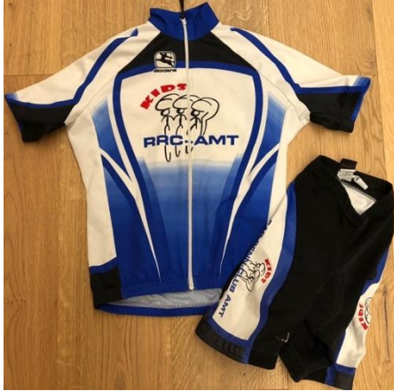
Kids Bike Set Typ 1: Trikot mit 3 Rückentaschen und Hose mit Polsterung.