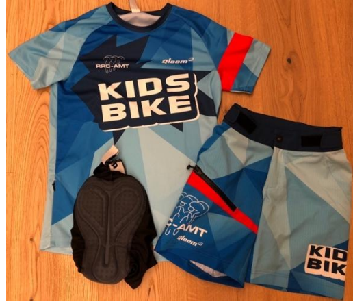
Kids Bike Set Typ 2: Trikot mit seitlicher Tasche (Reissverschluss), Baggy-Shorts mit Tasche (Reissverschluss) sowie separaten gepolsterten Innenhosen.